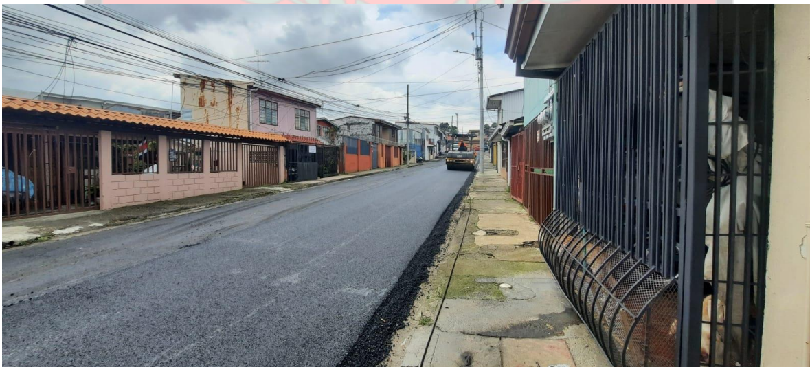
Imagen 2: Asfaltado San Gerardo.