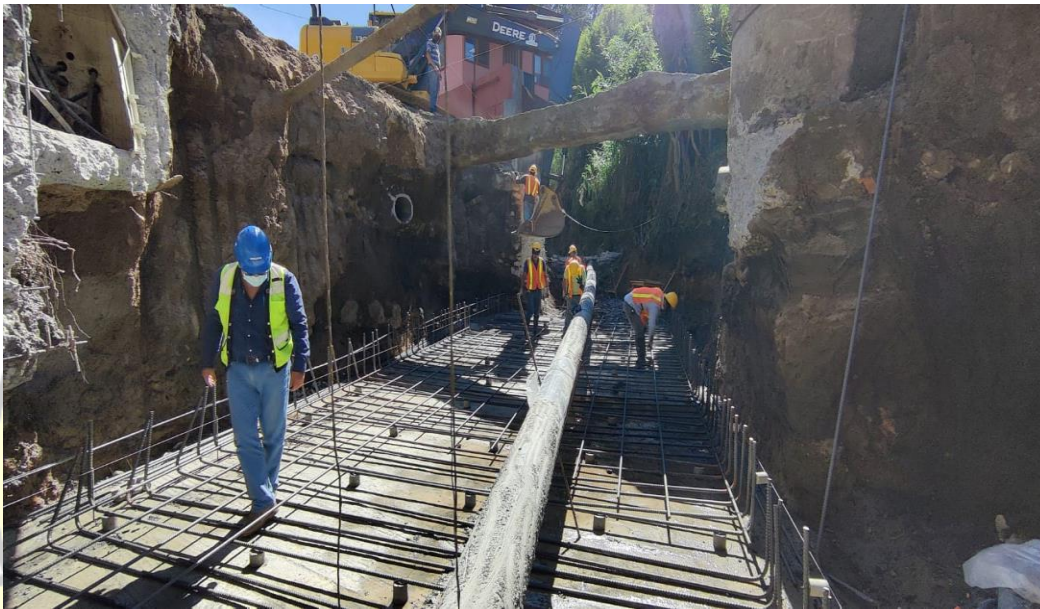
Imagen 11: alcantarilla 3 en límite entre Calle Blancos y San Francisco

Alcantarilla de cuadro 1, costo ₡ 125 000 000, código de camino 1-08-155