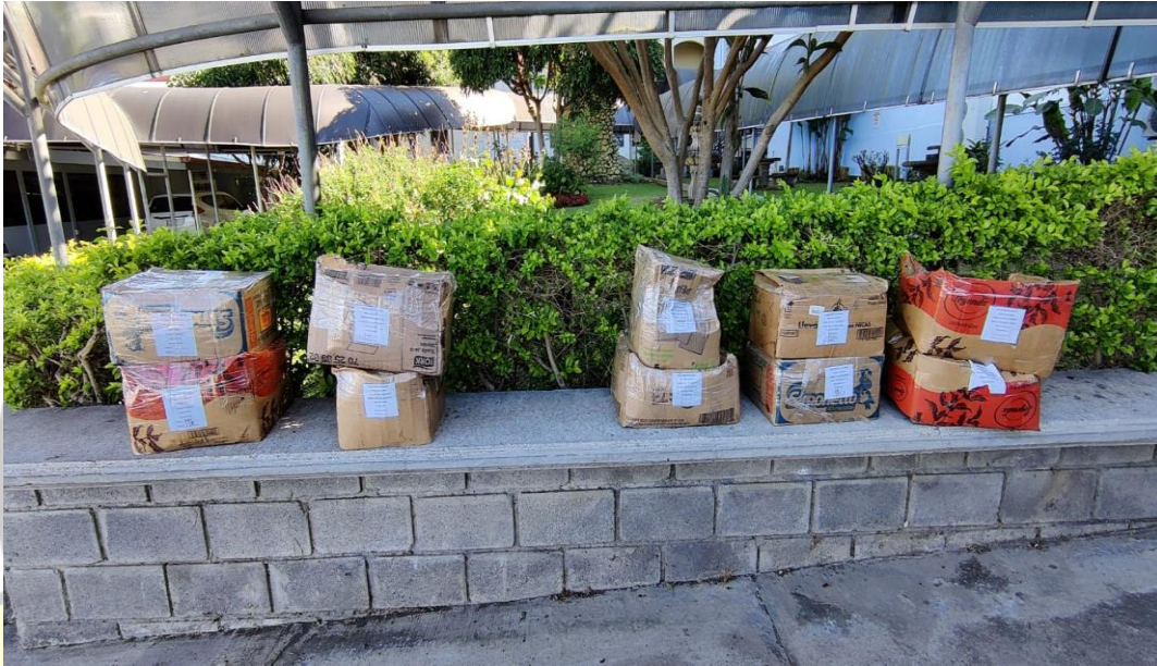
Imagen 20: muestreo de asfalto de proyectos ejecutados.

Control de calidad en la red vial cantonal, costo ₡ 8 690 544,4.