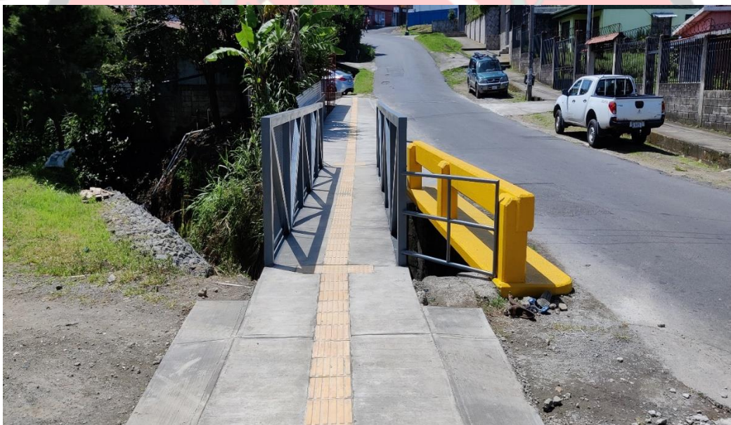
Imagen 12: Puente peatonal en río Ipís, código de camino 1-08-126.

Puente peatonal en Río Ipís, Mozotal, costo ₡ 30 000 000, código de camino 1-08-126 y reparación de fundación de bastiones del puente sobre el río Ipís en la comunidad de Los Ángeles en Ipís.