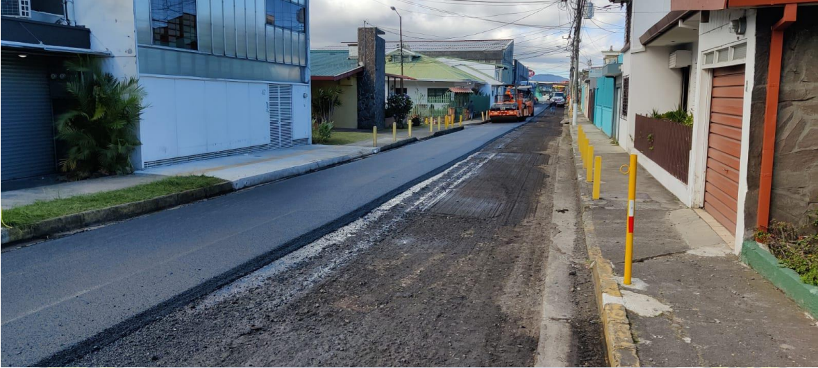
Imagen 23: colocación de carpeta asfáltica en Colonia del Río.

UNIDAD TECNICA DE GESTION VIAL MUNICIPAL MG-AG-UTGVMG-0011-2022