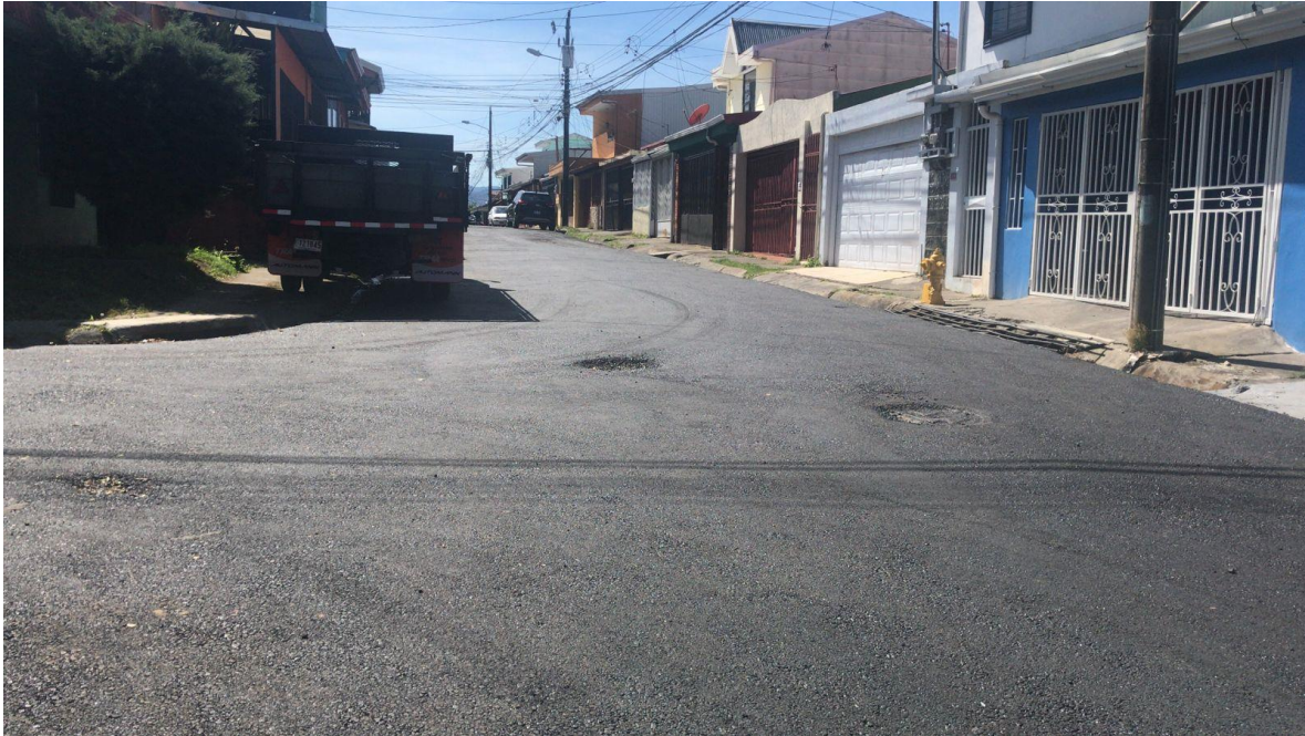
Imagen 9: bacheo menor en Jardines de Paz.

UNIDAD TECNICA DE GESTION VIAL MUNICIPAL MG-AG-UTGVMG-0011-2022