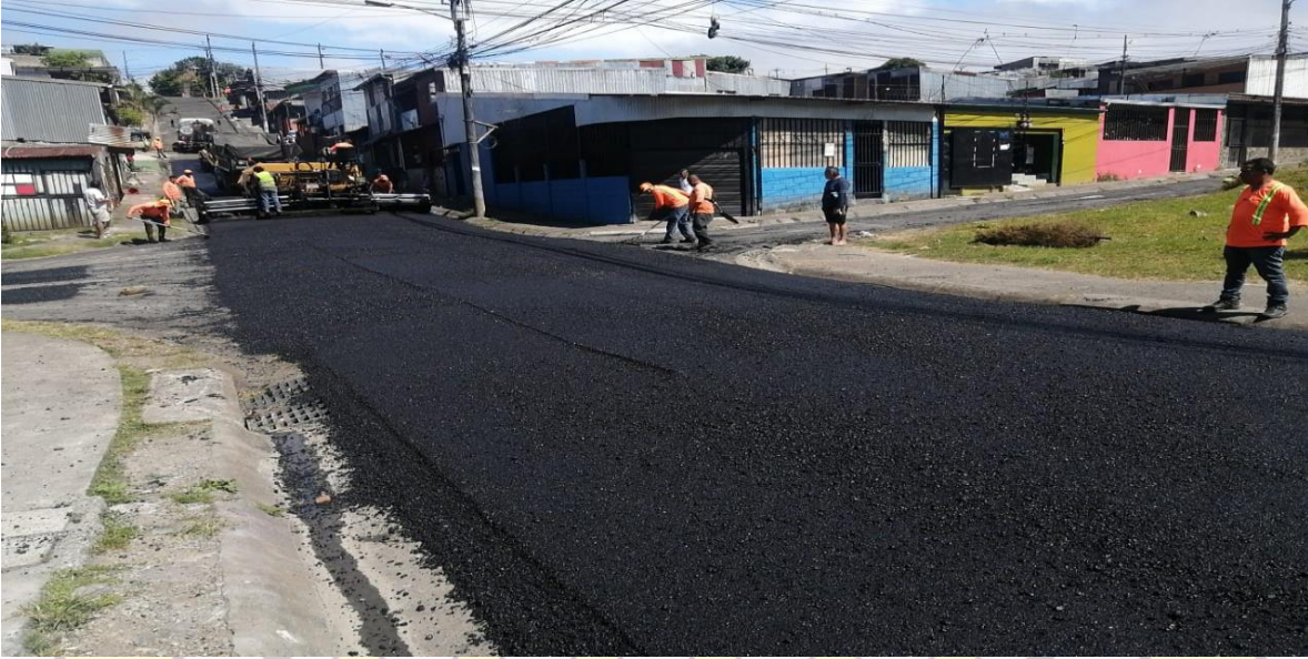
Imagen 7: bacheo menor en Nazareno.

UNIDAD TECNICA DE GESTION VIAL MUNICIPAL MG-AG-UTGVMG-0011-2022