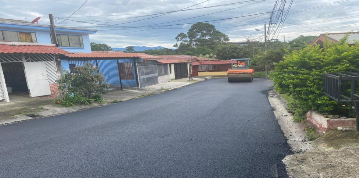
Imagen 3: asfaltado en Barrio Divino Pastor.

UNIDAD TECNICA DE GESTION VIAL MUNICIPAL MG-AG-UTGVMG-0011-2022