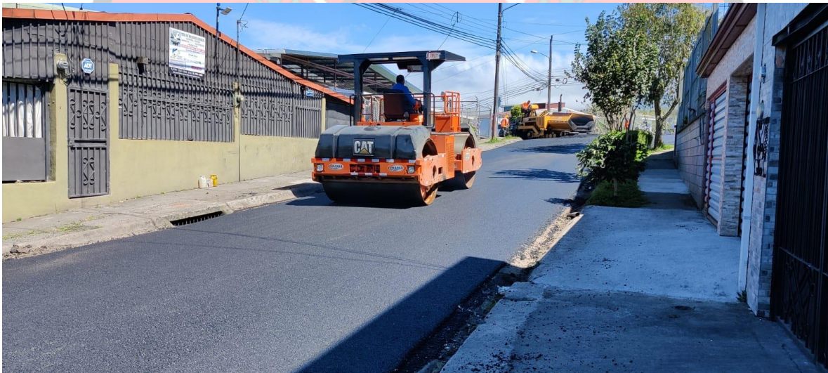
Imagen 22: colocación de carpeta asfáltica en Vistas del Valle.