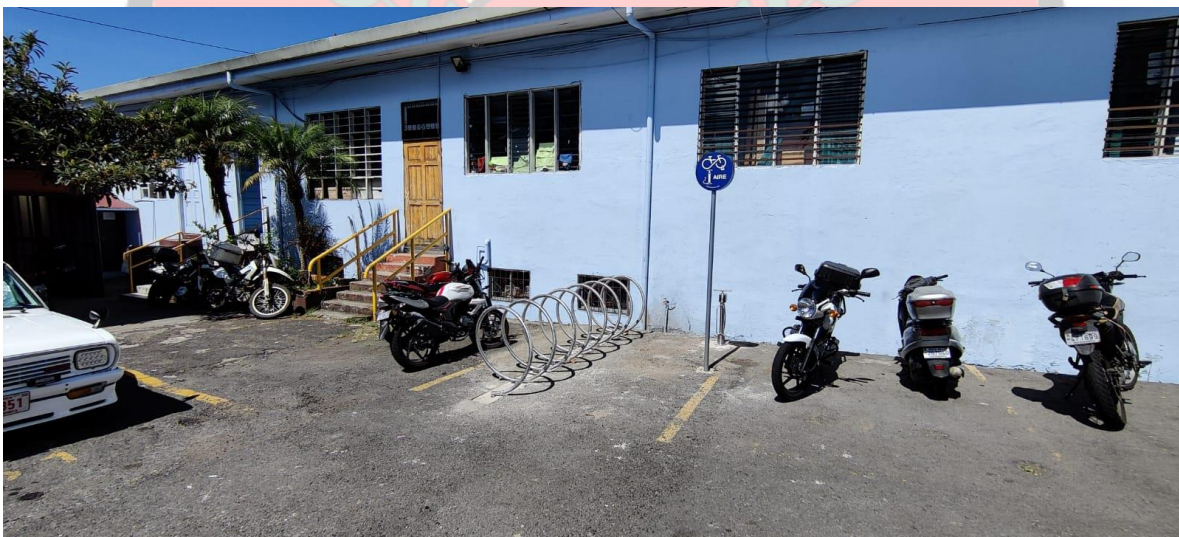
Imagen 26: colocación de ciclo parqueos en la Municipalidad de Goicoechea, Guadalupe.