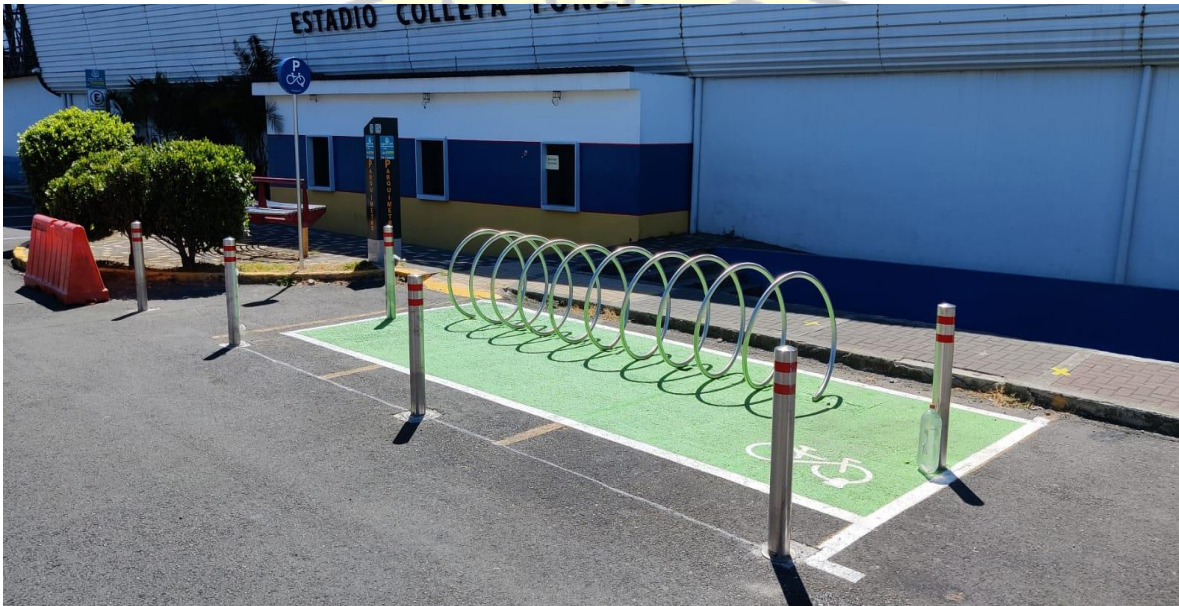
Imagen 25: colocación de ciclo parqueos afueras del estadio Colleya Fonseca, Guadalupe.

Lugares: Municipalidad de Goicoechea, afueras del estadio Colleya Fonseca y Comité de Deportes.