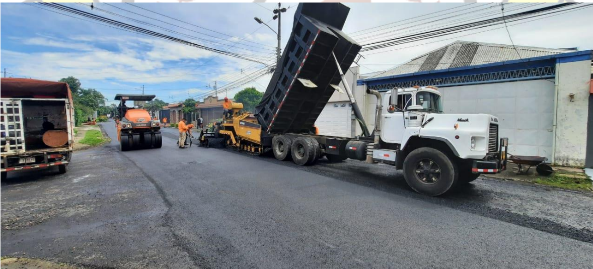
Imagen 4: Asfaltado en Bernardo Iglesias.