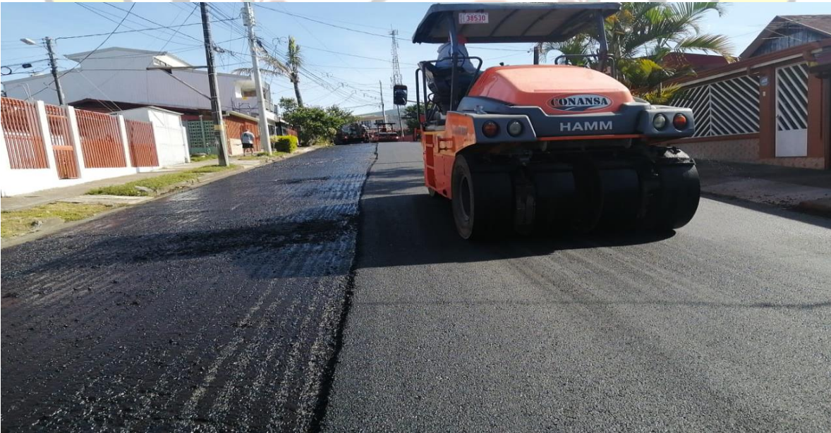
Imagen 8: bacheo menor en La Facio.