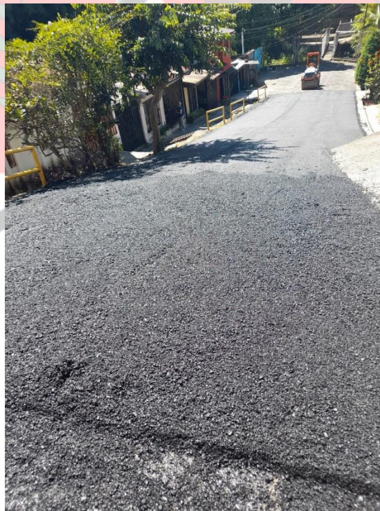
Imagen 9: bacheo menor en Barrio La Josefina.