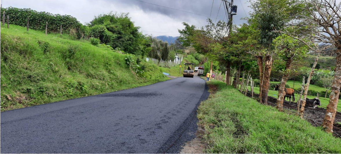
Imagen 5: Asfaltado en Jaboncillal.

UNIDAD TECNICA DE GESTION VIAL MUNICIPAL MG-AG-UTGVMG-0011-2022