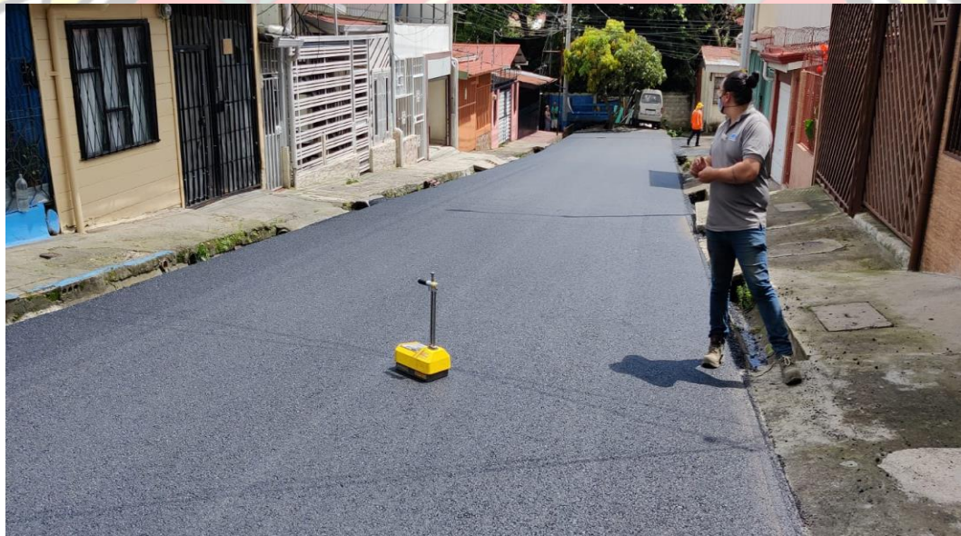
Imagen 21: medición de compactación con el densímetro nuclear.