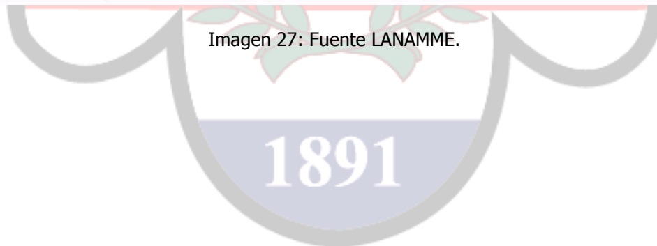
Imagen 27: Fuente LANAMME.

Fuente: Informe LM-PI-UP-05-2015 Actualización de los criterios para la evaluación visual de puentes