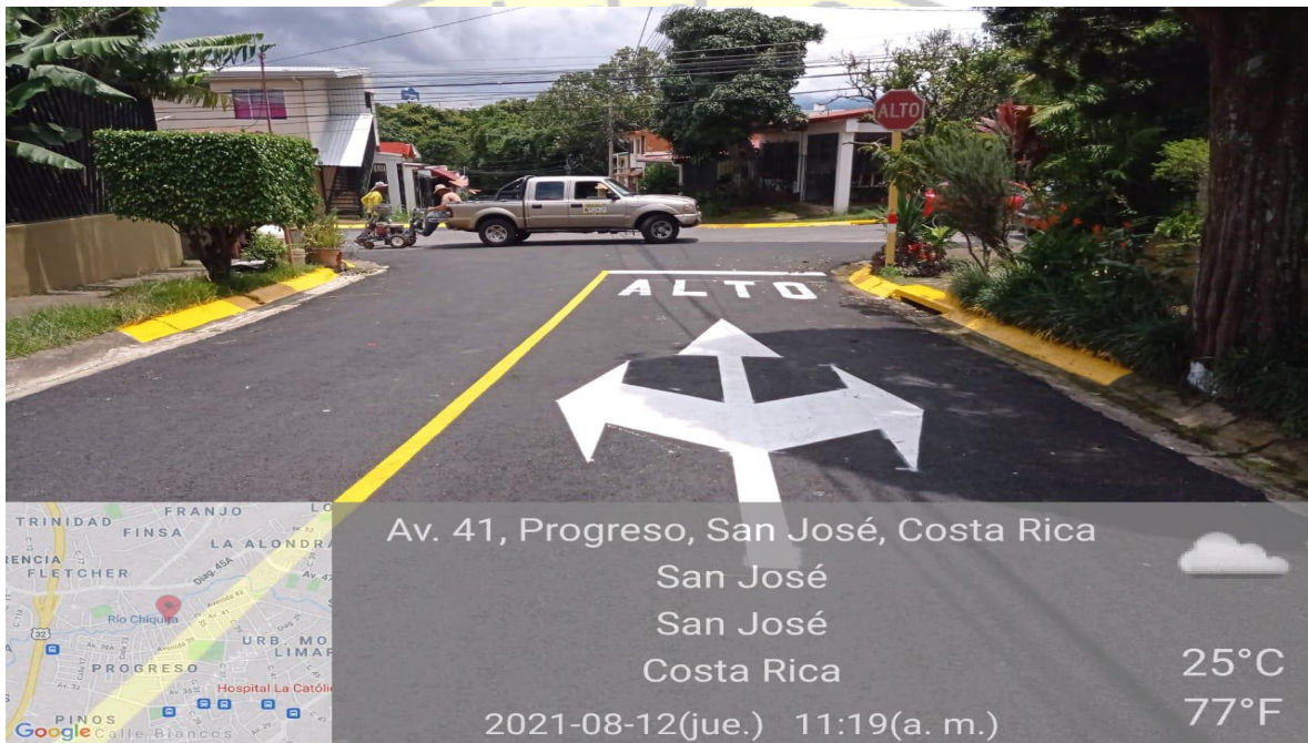
Imagen 1: asfaltado en Calle Blancos, Montelimar.