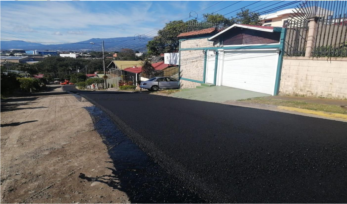
Imagen 24: colocación de carpeta asfáltica en Montelimar, Calle Blancos.