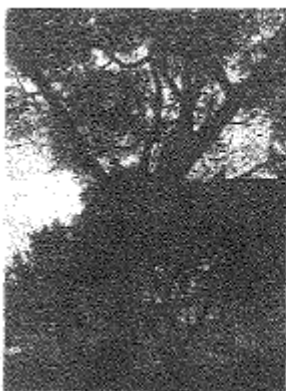
Árbol de Guanacaste