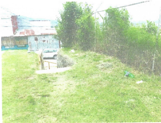
Final de la alameda con existencia gradas