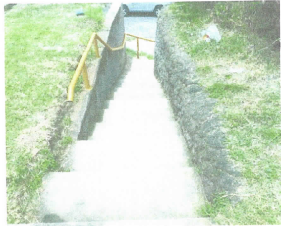
Las gradas tienen baranda