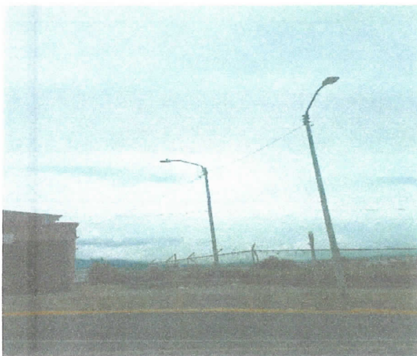
Vista panorámica desde calle principal