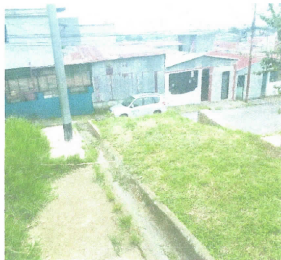
Fin de la Alameda